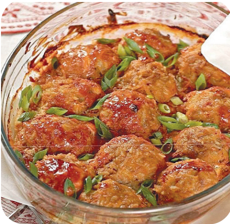
Рис - 0,75 стак. Сметана - 250 г. Яйцо - 1 шт. Фарш - 800 г. Масло растительное - 1 ст. л. Соль - по вкусу Острый томатный соус - 3 ст. л. Луковица - 2 шт.