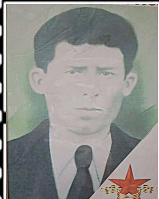
БЕТЕЕВ Арсен Бясович (1906–1942 г.)