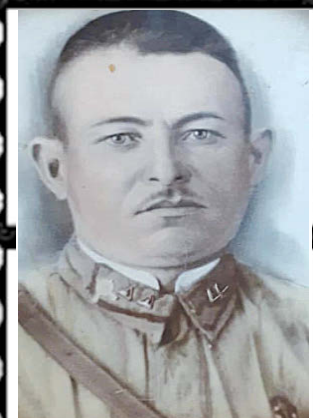
КОКОЕВ Александр Павлович (1907–1943 г.)