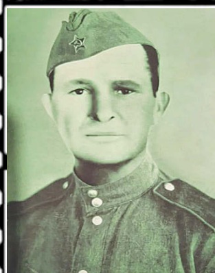
ТЕДЕЕВ Газан Амзорович (1906–1972 г.)