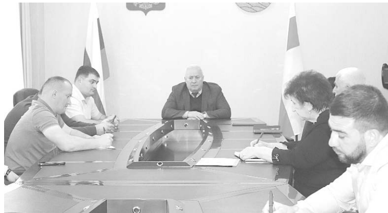
В АМС Пригородного района состоялось заседание с сотрудниками центра по противодействию экстремизму РСО – Алания.

В ходе заседания были рассмотрены вопросы противодействия экстремизму в молодежной среде, виды ответственности за различные противоправные деяния. Шел раз-