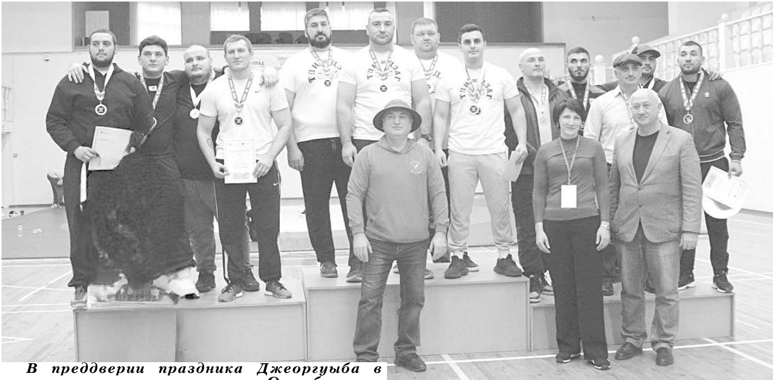
В преддверии праздника Джоргуыба в спортивном комплексе селения Октябрьского Пригородного района прошли III ежегодные соревнования по национальным видам спорта "Иудзинады зилахар".

Вот уже третий год подряд при поддержке Министерства спорта РСО – Алания, организации "Аланты ныхас" и общественного движения "Иудзинад" в спортивном комплексе проводятся соревнования между осетинскими фамилиями. Необходимый инвентарь и список видов состязаний предоставила Северо-Осетинская республиканская физкультурно-спортивная общественная организация "Федерация национальных видов спорта, мас-рестлинга и культуры" ("Ирон федераци"), и уже несколько лет он не претерпевает изменений.