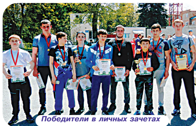
Победители в личных зачетах

6 мая в с. Октябрьском (зал борьбы ДЮСШ №1, СОК им. Е.Тедеева, стадион) прошла спартакиада среди обучающихся в ДЮСШ №1 Пригородного района по военно-прикладным видам спорта "Отчизны верные сыны", посвященная 72-й годовщине Победы в ВОВ 1941-1945 гг.