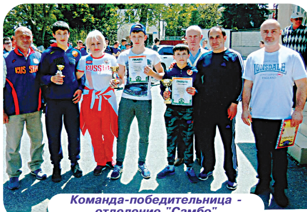
Команда-победительница - отделение "Самбо"

бо были первыми и по метанию гранаты, соревнования проходили также на стадионе.