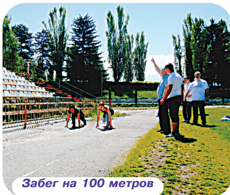
Забег на 100 метров

Соревнования проходили на должном уровне благодаря честному судейству Б. Стофорандова (гуманитарный