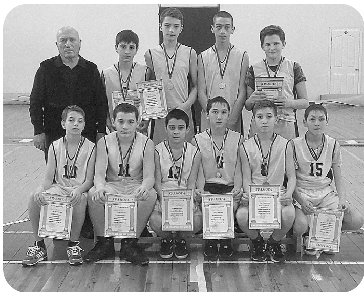
Администрация местного самоуправления муниципального образования Пригородный район Республики Северная Осетия - Алания