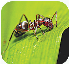
Обоняние у му- равьев развито по- чти так же хорошо, как и у собак. Орга- ны обоняния (и ося- зания) расположены у них на усиках.

Обоняние для му- равьев гораздо важ- нее зрения, которое у них плохое. Слеплен- ный муравей с усика- ми может добраться домой. Муравей, ли- щенный усиков, теря- ет способность нахо- дить дорогу к гнезду, перестает распозна- вать взрослых и личи- нок своего вида, не участвует в строитель- стве. Нормальное по- ведение его сразу и полностью нарушает- ся.