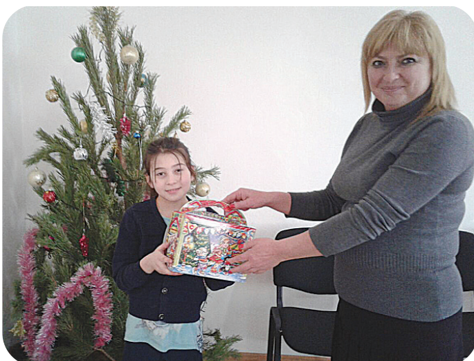
Ирон адæм дæр кад лындз зæронд Ног азыл. æмæ радимæ сæмбæ- Алкæмæн дæр хорздзи.