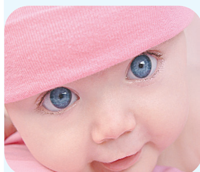
Цвет глаз, точнее, цвет радужной оболочки глаза зависит от пигмента меланина. Когда его много, глаза темно- или светло-карие, а когда мало - серые, зеленоватые или голубые.

Большинство новорожден- ных детей имеет одинаковый голубовато-серый цвет радуж- ной оболочки (радужки). Причи- на - в том, что у новорожденно- го в радужке еще нет пигмента меланина, который отвечает за ее цвет. Если наследственность ребенка такова, что с возрастом цвет глаз должен будет поме- няться, меланин будет выраба- тываться по мере роста ребен- ка. Постоянный цвет глаз уста- навливается приблизительно через 1,5 года после рождения, реже - к двум-трем годам.