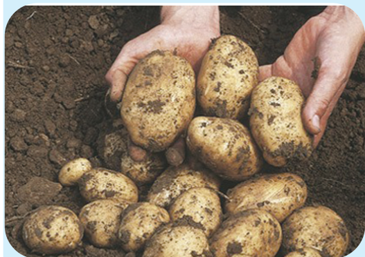
Родина картофеля - южноамериканские горы Анды. Там, на высоте от 500 м. и до 5 км. растут почти все известные виды картофеля.

Трудно пред- ставить, что такой обычный продукт на нашем столе, как картошка, был когда-то редким лакомством. В Европу картофе- ль был завезен в XVI веке испанцами. Вме- сте с золотом и серебром, кото- рыми конкиста- доры нагружали свои каравеллы, они брали с со- бой в дорогу и клубни карто- феля, которые очень дорого ценились. Сначала испанцам новый плод не понравился. Это неудивительно - расска- зывают, что они пробовали