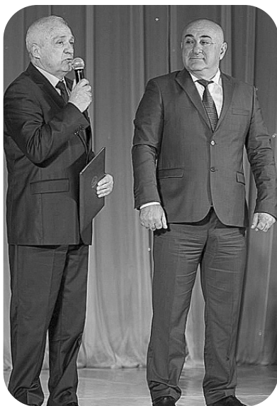
В минувшую пятницу во Дворце культуры ГГАУ

чествовали передовиков сельскохозяйственного производства со всех районов республики, в т.ч. и нашего.