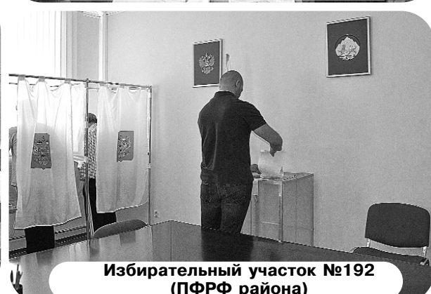
Избирательный участок №192 (ПФРФ района)