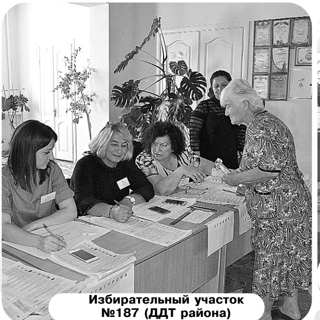
Избирательный участок №187 (ДДТ района)