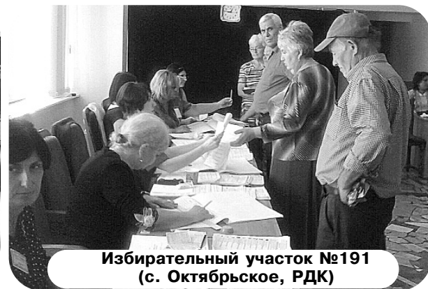
Избирательный участок №191 (с. Октябрьское, РДК)