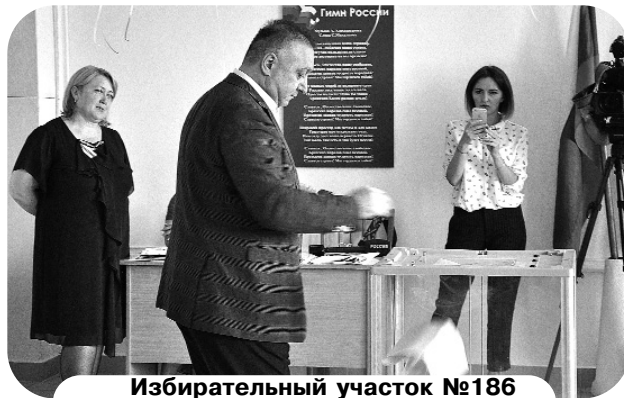
Избирательный участок №186 (СОШ №1 с. Камбилеевского)

ГАССИТЫ Моисей. ТЕДЕТЫ Маргаритæйы ист къам.