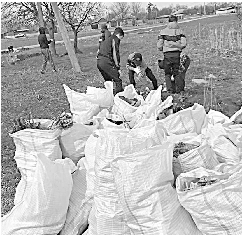
кам регионального оператора сельского поселения Тамара "Эра" за своевременный вывоз Табуева. Соб.контр. собранного мусора, - прокомментировала глава Камбилеевского

Уважаемые жители! Даже еженедельными субботниками вряд ли удастся устранить проблему, пока мы сами не воспитаем в себе и своих детях ответственное отношение к месту последнего пристанища наших родственников и близких! Давайте не забывать о том, что чисто не там, где убирают, а там, где не сорят. Огромное спасибо сотрудни-