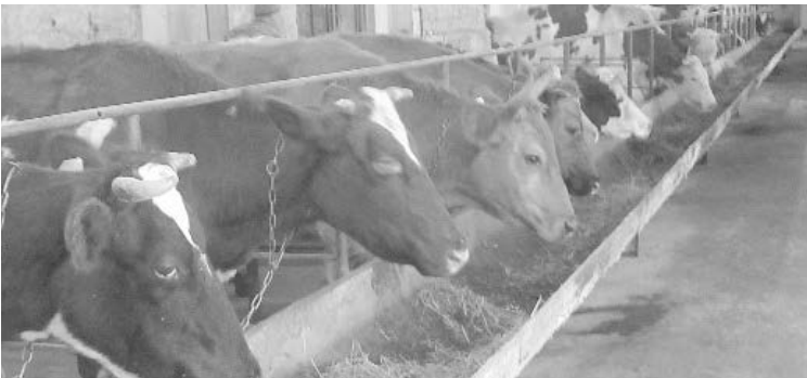
На ферме Амираана КУЛУМБЕКОВА всегда чисто, и скот накормлен